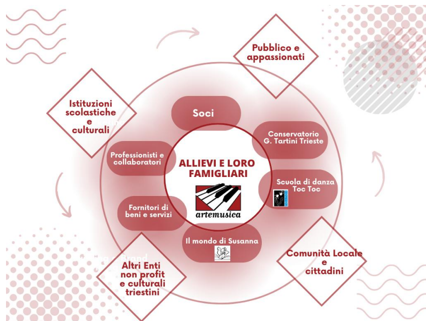
Mapa degli Stakeholder